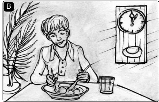
Ich habe zu Mittag _____.