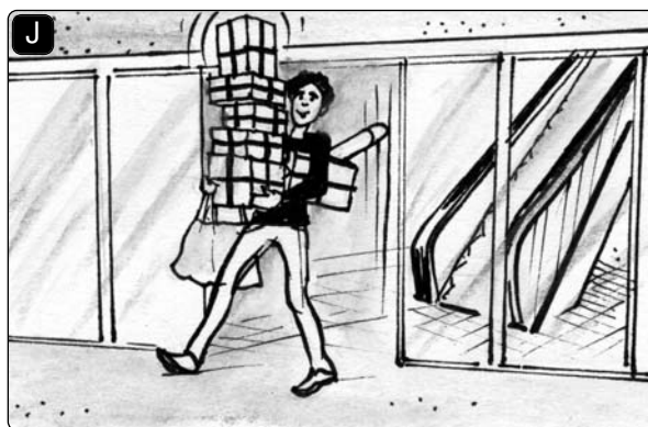
Ich habe _____.