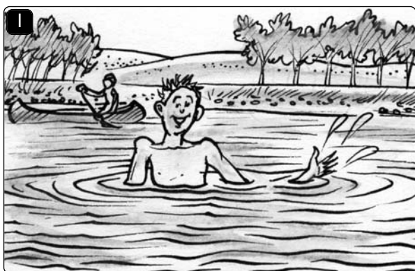
Ich habe im See _____.