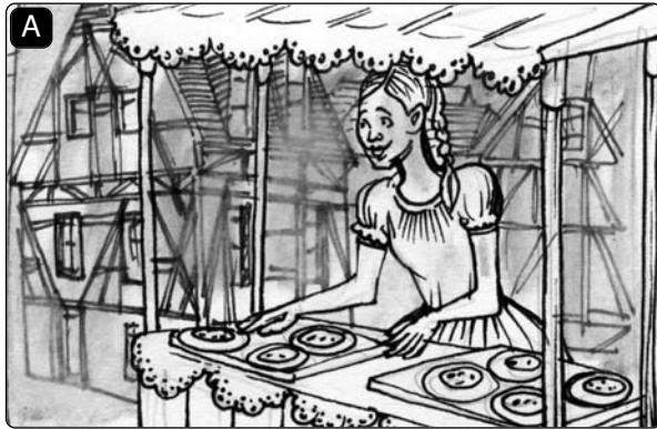
Ich habe Kuchen _____.

Die Schüler arbeiten in Gruppen. Jede Gruppe hat einen Satz mit Bild- und Textkärtchen. Die Schüler ergänzen im Satz die passenden Verben in der richtigen Form, z. B.: Ich habe Kuchen verkauft . Sie schreiben den Infinitiv des Verbs ( verkaufen ) auf die Rückseite des Kärtchens. Dann arbeiten die Schüler im Plenum. Der Schüler einer Gruppe zieht ein Kärtchen (z. B. A) und liest den Infinitiv laut vor: verkaufen . Die Schüler der übrigen Gruppen suchen das entsprechende Kärtchen und lesen den Satz laut vor: Ich habe Kuchen verkauft .