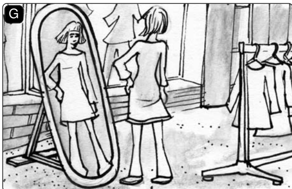
Ich habe Klamotten _____.