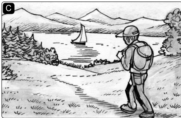
Ich habe einen Ausflug _____.