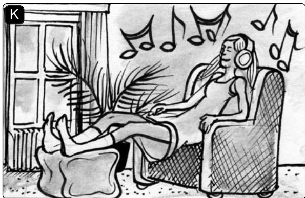
Ich habe Musik _____.