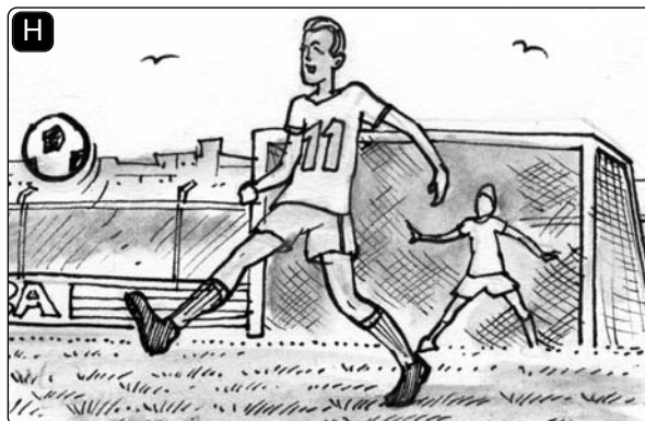
Ich habe Fußball _____.