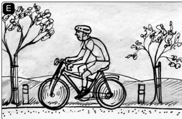
Ich bin Rad _____.