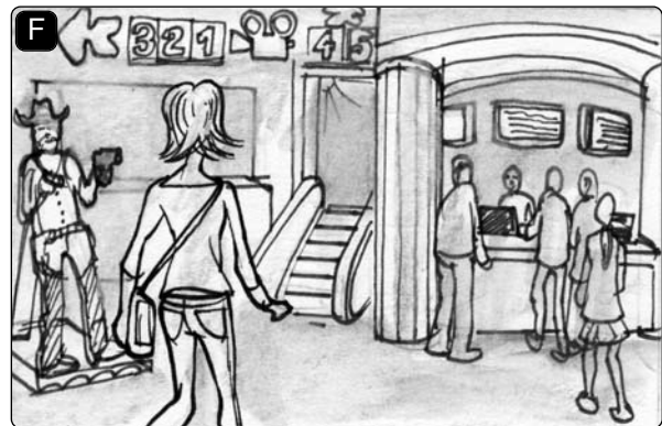
Ich bin ins Kino _____.