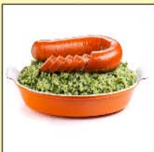
Wurst mit Grünkohl